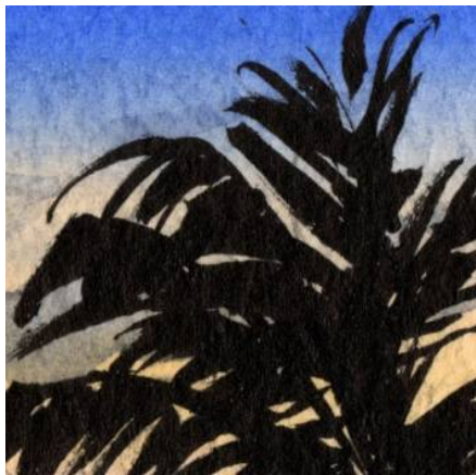
4、南国らしい樹木も すべてシルエットだけで表現