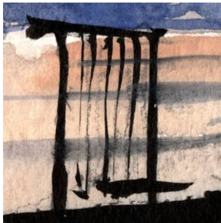
5、海辺のブランコは 構図上貴重な存在です