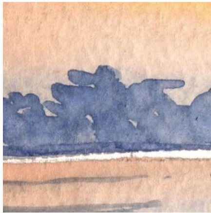
2、水平線近くの雄大積雲 (入道雲) 薄い青紫で