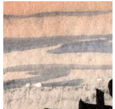
6、控えめなさざなみで「静けさ」を表現しました