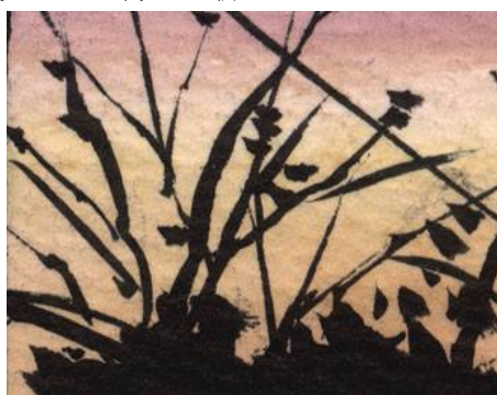
5、冬枯れの樹木で季節感を出せます