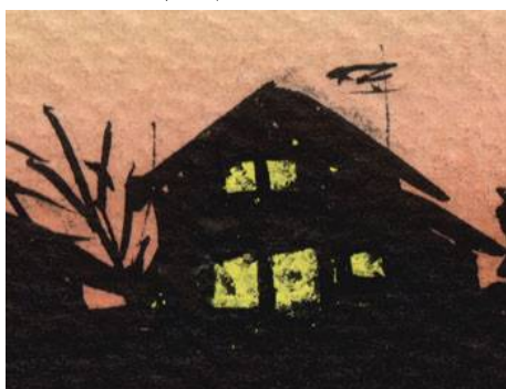
3、住宅のシルエット 拡大すると何とも雑なタッチ