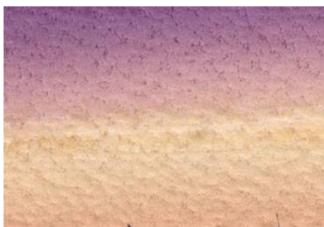
2、紫からジョンブリアン（肌色）へのグラデーション