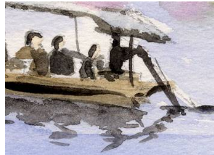
6、小舟の人物と影 対岸の影とちがって 黒くはっきりと