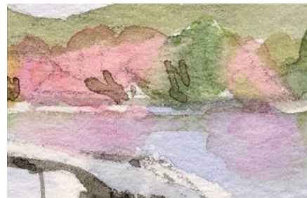
5、対岸の花樹も反映させます 桃色が入ると いかにも春らしく感じます