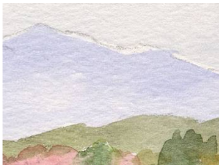
2、遠景ほど霞ませて描きます これを「空気遠近法」といいます