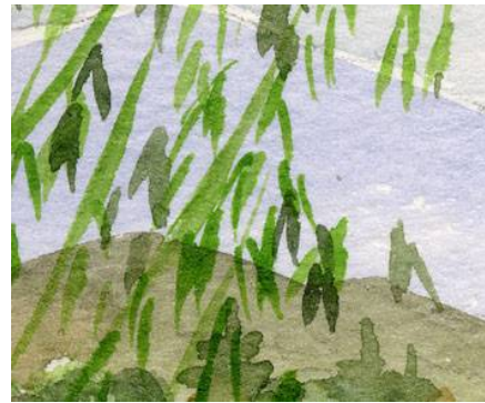
4、柳は一枚の葉を一筆で 軽妙なタッチで描きます