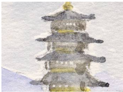
1、遠景の仏塔 最初濃く描きすぎたので 乾いたあととぬらして ふき取りました