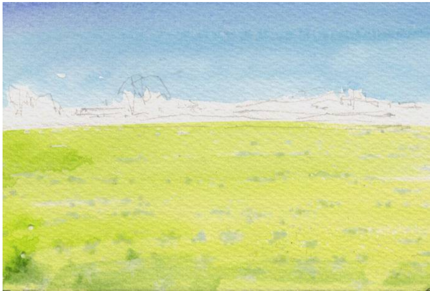
1、花の部分はマスキング液で抜いておきます その後まずは薄く下塗りをしておきます

上林 暁に「野」という作品があります 上林は武蔵野の自然風土を深く愛した作家ですが 特に「野」の散歩を好みました 「野」にはっきりした定義はありませんが 「遠くまで見渡せる草原」は一応「野」の範疇に入るでしょう 春の野は花が咲き 一番美しい季節です