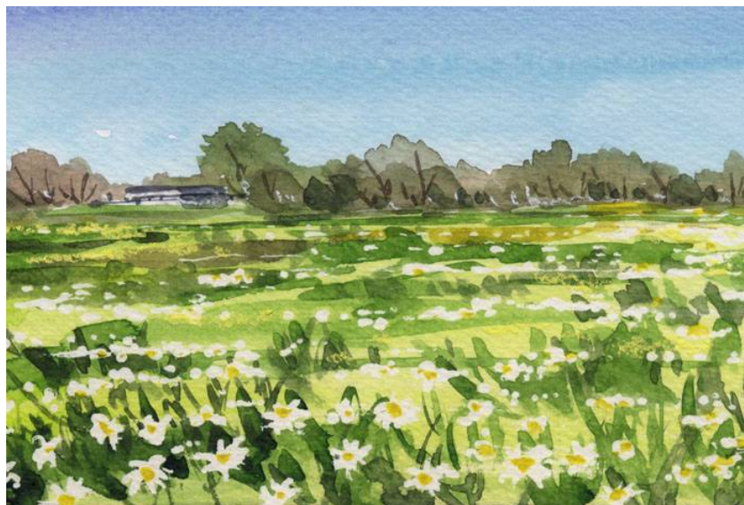
4、絵の具が完全に乾いたらマスキングをはがし 細部を描いて完成です