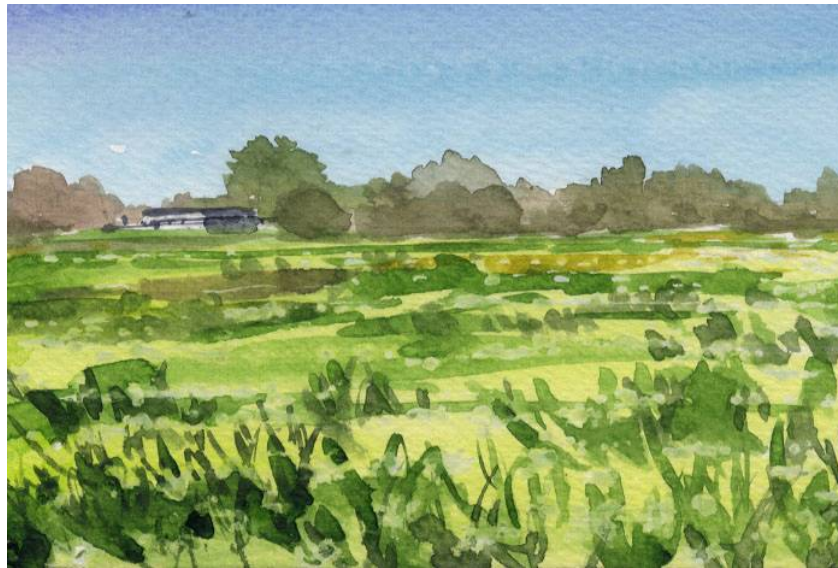
3、背後の森は まだ冬枯れの色 紫をうまく使うことが大切です