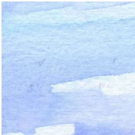
1、空は意識的に塗る残しをつくります