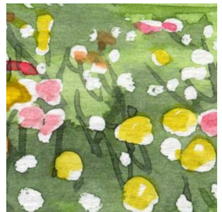
6、塗らずに白のままの花も残しましょう