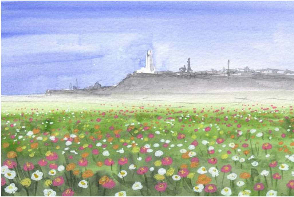
これが完成した絵です

水彩画は 濃い背景の手前に 淡い色のものを描くのが難しい画材です そのような題材には「マスキング液」を使います これは速乾性の液体ラテックスで これを塗ったあとに絵の具で描き 乾いてから指先で剥ぎ落とす その部分がきれいに白く抜けます この絵もマスキング液を使いました 私はこの絵画とても気に入っています