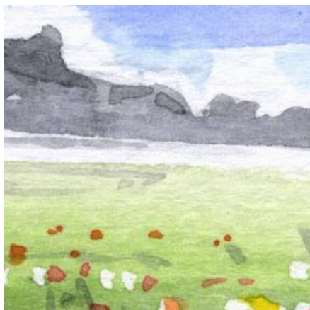
4、遠くの草原は 少し霞む感じに