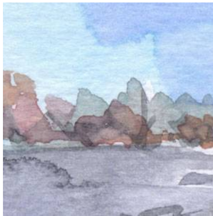
2、岬上の樹木 ほんの少し春色を