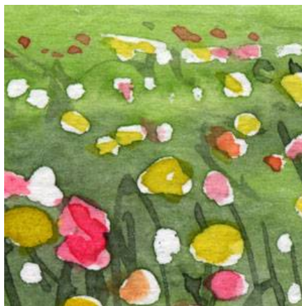
5、花はマスキングをはがしたあと 塗ります