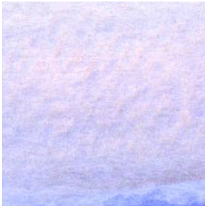
1、地平線のすぐ下に太陽があるので 空はこんな色になります 「ヴィーナス・バンド」といいます