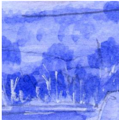
2、湖の対岸の丘には針葉樹の森 湖畔には白樺を描きます