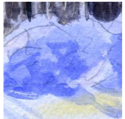
6、除雪した雪の堆積は 立体感が今一つでした これも研究中です