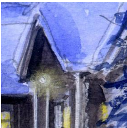
4、外灯りは 雰囲気が出るように パステルで少し滲ませるように描きました