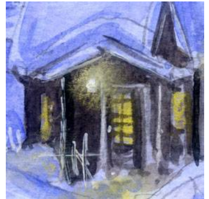
3、コテージの入口 外は極寒ですが 中の暖かさも表現したいと思いました