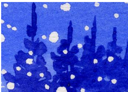
2、背後の樹木は 空の色が完全に乾いてから 重ねます