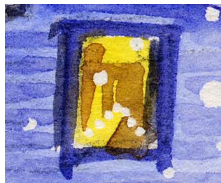
5、明るい窓にも 7つの光のユールストックを