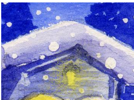
3、屋根の雪は 何回か青紫を重ねて 立体感を出します