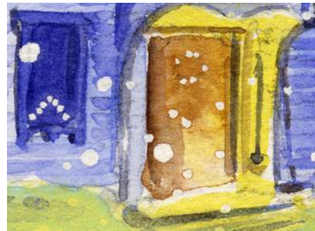
4、玄関からは光があふれるように ステップの立体感も大切です