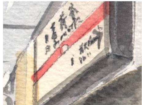
6、駅名板は重要ですが 丁寧に描きすぎないように