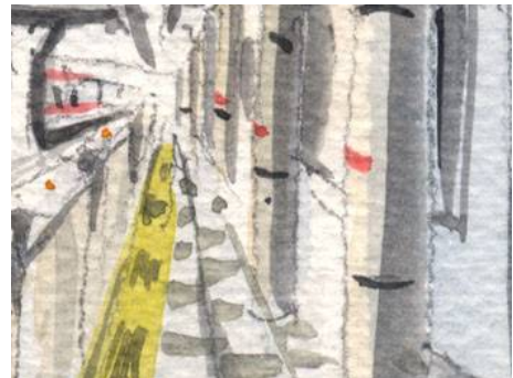
5、ホームの構造物は 線遠近法で描きます