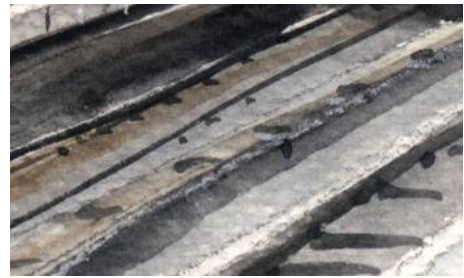
4、線路の描き方 丸ノ内線独特の集電軌条があります、