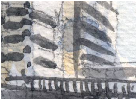
1、マンションの表現 窓は暗く描きます