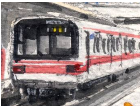
3、主役の丸ノ内線 ツラガマエがむずかしいです