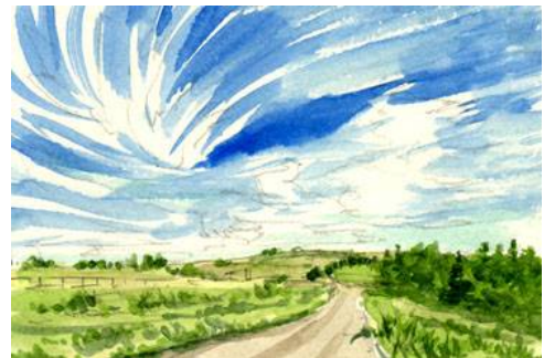
6、特に針葉樹は思い切って暗い緑を置きます 最後に牧場の柵を描いて完成です