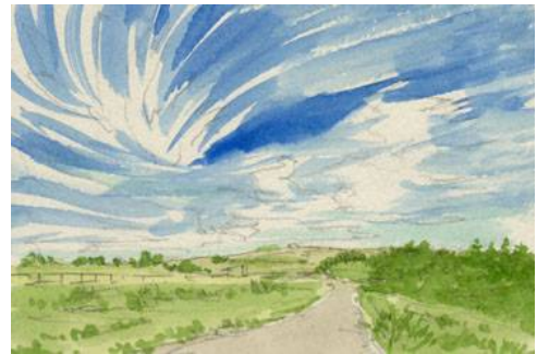
5、全体のバランスを見ながら 更に色を重ねていきます