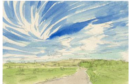
4、地上は少しずつ濃い緑を重ねていきます