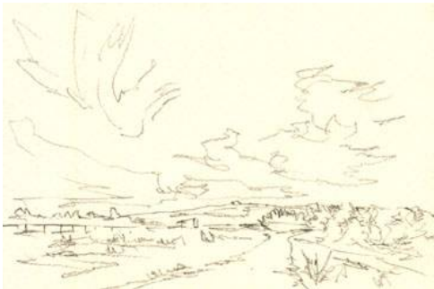
1、主題は雲なので 下絵は空3分の2 地上3分の1としました