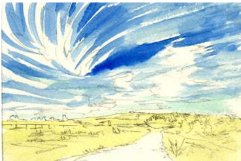
3、地上は「リーフ・グリーン」を薄く 面的に塗っておきます