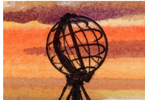
4、地球型のモニュメント シルエットで描きます