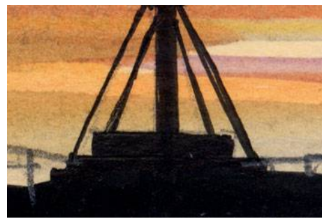
5、土台はこんな感じで ペンも使います