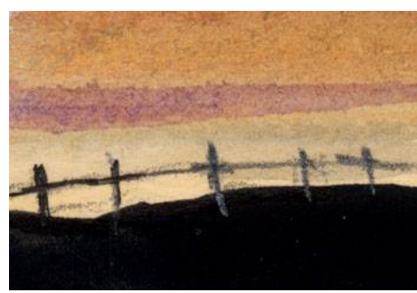
6、柵は鉛筆で描きました