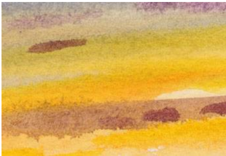
1、空のグラデーション 黄色・橙・赤をにじませて