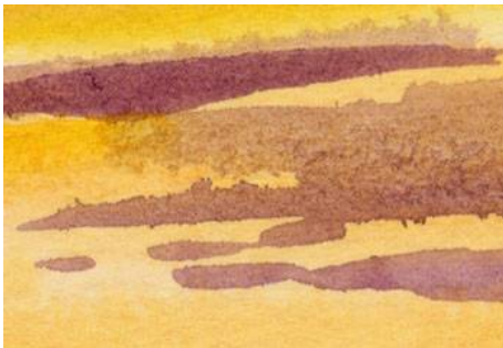
2、雲は紫にたなびかせます 適度ににじませて