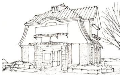
2、2階部分を描きます 屋根の角度や重なり具合に注意して