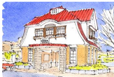
5、駅舎の細部を少しずつ塗っていきます 一部分だけ丁寧に描かないよ うに