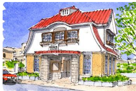
6、最後の決め手は「かげ」です 軒下にかげを入れると立体感が出ます