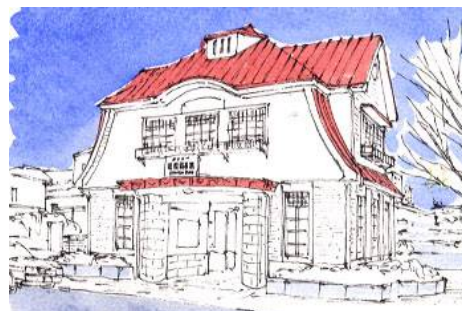
4、空を最初に 屋根の赤い部分も一気に塗ってしまいます