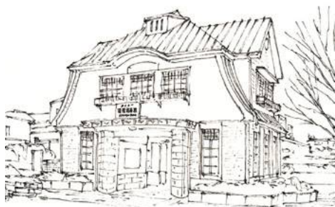
3、窓の細部 背景を細かく描き 最後に駅名も書いておきましょう