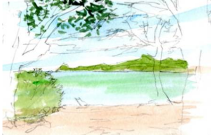
2、対岸の岸 手前の砂浜 樹木の葉などを少しずつ描いておきます