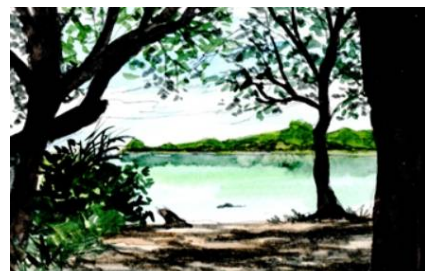
6、全体のバランスを見ながら 樹木の葉などを適度に加えて完成です