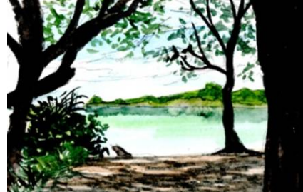
5、ここで初めて樹木の幹を描きます セピア+ブラックですが 完全にシルエットでも良いです