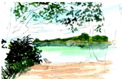
3、樹木の葉を濃くしていきます 逆光なので ややシルエットになるように 対岸も少しずつ色を重ねます