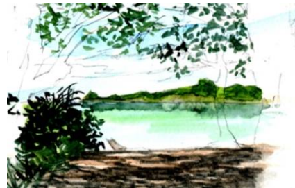
4、砂浜の「木れ日」を表現します まだ樹木の幹は描きません