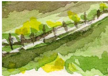
5、岬の小道に黄色い花 春らしさを表現します