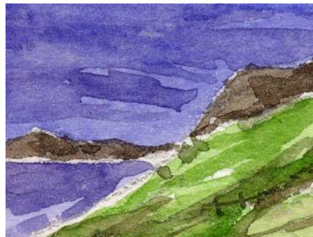
6、崖と岩と海面の表現 海面には紫も使います