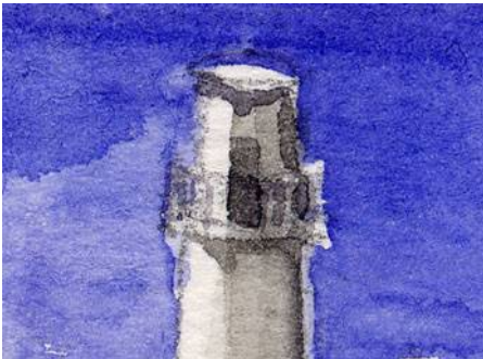
2、灯台の頭部 海の青に塗り残して その後立体感を