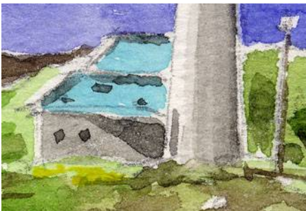
3、灯台の基部と付属の建物 左から日光が当たっていると 強く意識して