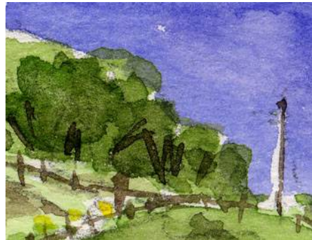
4、岬の台地の灌木 サップグリーンとシャドウグリーンを重ねて