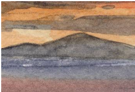
2、遠くの島ほど淡く見えます その通りに淡く描きます