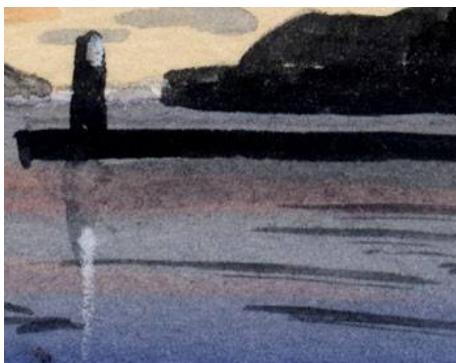
3、灯台の反映 これもパステル鉛筆が便利です