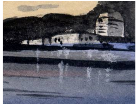
4、岸の建物と その灯火の反映 白のパステル鉛筆を使っています