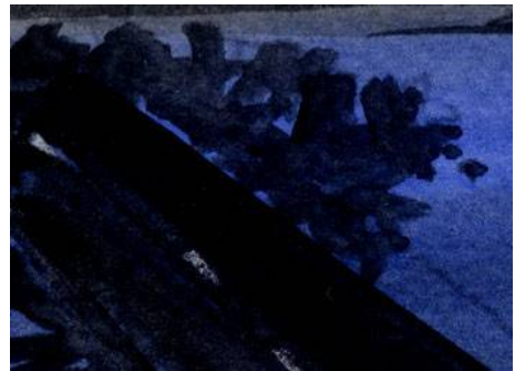
5、突堤のテトラポットが難しいです シルエットなのが幸い