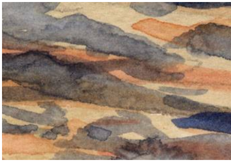
1、朝焼けの層積雲 さまざまな色を少しずつ重ねます