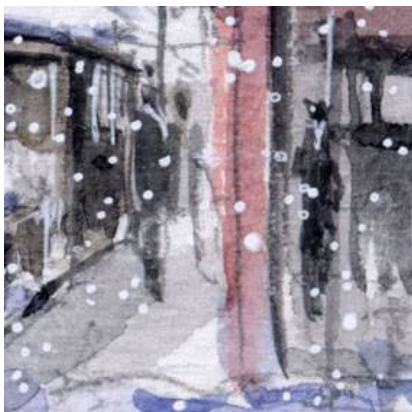
4、乗客と駅員さんは 少し霞がかかったように描きました