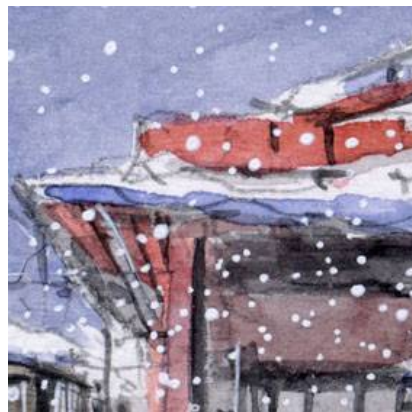
5、赤い屋根の特徴を残しながら 雪が積もったように描くのが大変でした