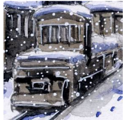
3、雪の中に 暗い色の機関車はよく合います 右側の面が影になるように描きます