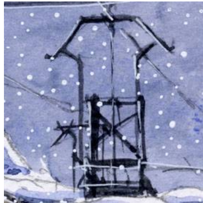
2、独特の大きなパンタグラフが特徴です これを描かないと草軽の機関車になりません