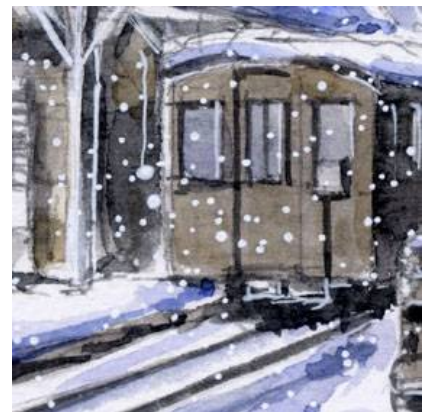
6、向かいの線路の古い客車 線路に雪が積もっている様子の立体感が難しい