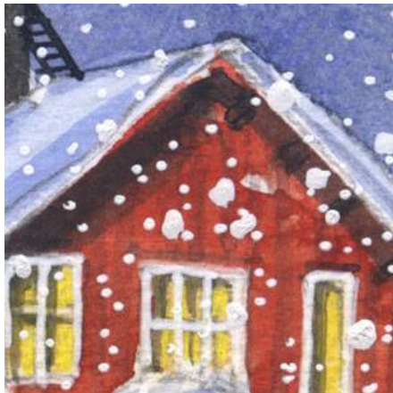
5、窓は温かく 白い縁取りを忘れずに