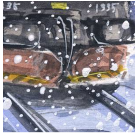
3、除雪版は重要 線路はくっきりと