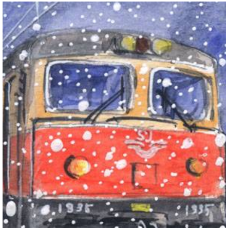
2、日本のものと違い 列車の顔が難しい