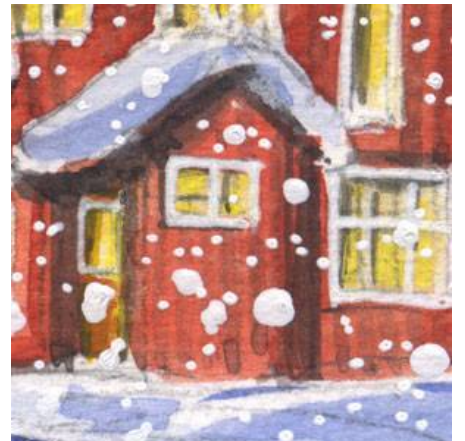
6、こういう立体的な構造物が難しい