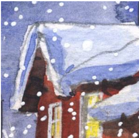
4、屋根に積もった雪を「重々しく」