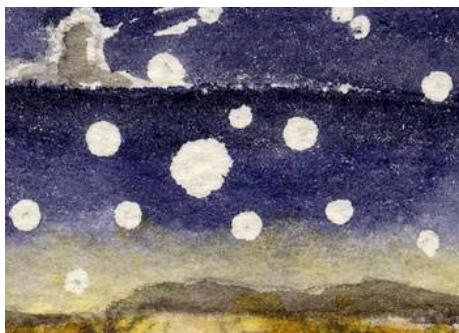
3、屋根の雪の表現 底に近いほど 明るく グラデーションで