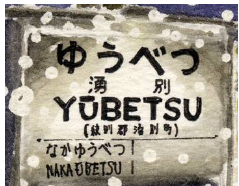
6、駅名板は少し丁寧に描きます 上部の電灯に照らされた様子をうまく表現