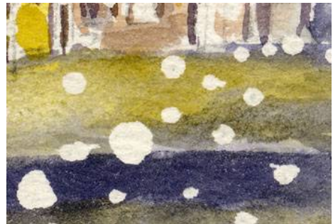
5、雪に反映した駅舎の灯火 黄色とブルーをうまく配色します