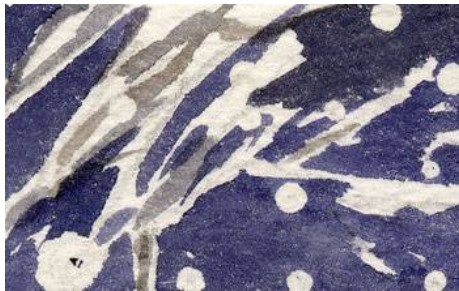
2、枝に積もった雪は マスキングを使わず うまく塗り残します