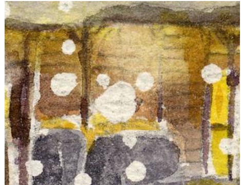
4、庇の下の灯火 寒い風景の中に 暖かい雰囲気を出します