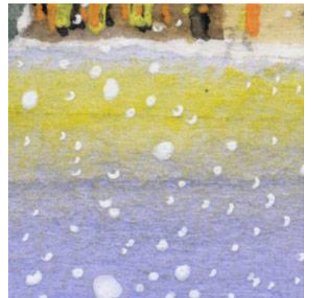
6、手前の雪への反映は 黄色と白のパステルを指でのぼして表現しました