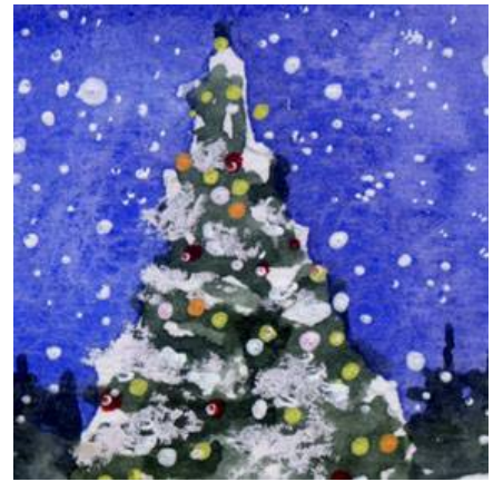
3、手前のツリーに積もった雪に 白のパステルを使用しましたが これはやめたほうがよかったです