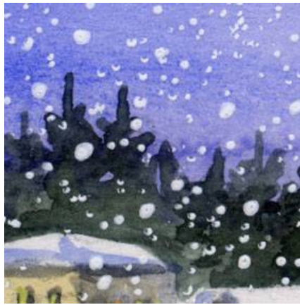
2、背後の針葉樹の森は シャドウグリーンに更にブラックを加えて描きました