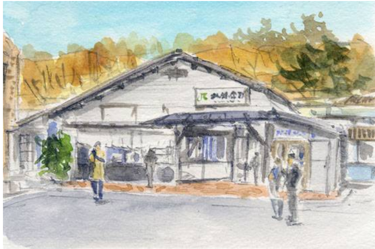
これが完成した絵です

通勤・観光両方で活躍する横須賀線にあって 北鎌倉駅は異彩を放っています 小さな木造の駅舎 長大なホームの一番端にある改札口 それに改札口の中にある構内踏切・・・実にJRっぽくない駅です こんな駅にグリーン車まで連結した15両編成の電車が ひっきりなしに発着しています 東京駅から1時間足らず この小さな駅に降り立つと 大きな駅では感じないほっとした気持ちになるから不思議です