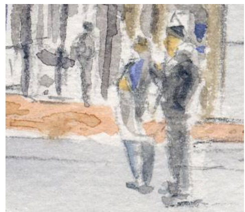
6、語らう人物 人物は画面に動きを出します