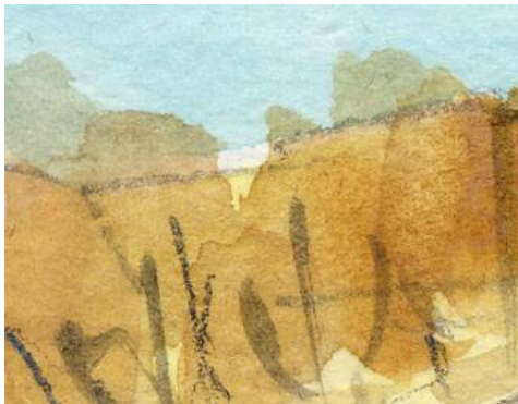
1、背後の秋色の林 樹木の幹は 鉛筆も使います