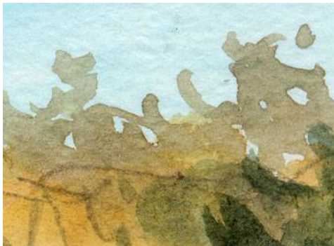
2、遠い樹木は少し淡く描きます