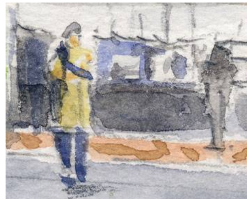
5、切符売り場っぽい場所と 澄ました人物