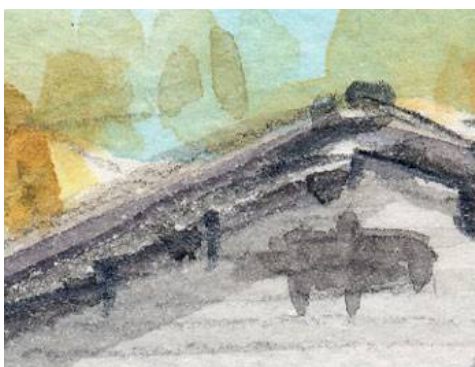
3、屋根の立体感と 影のつけた ここは重要です