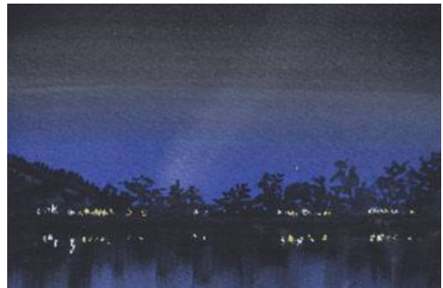
5、対岸の灯火は 白と黄色のパステルで点描風に