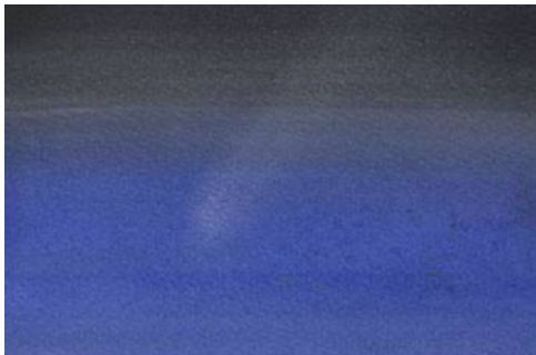
2、主題の黄道光は白のパステルで 淡く控えめに