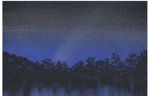
4、森影の反映です 平筆で素早く描きます(難しいです)