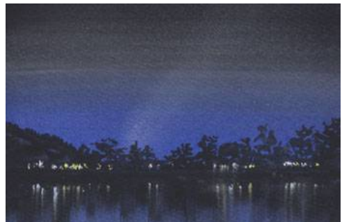
6、灯火の反映の部分だけ下に引き伸ばします 星を描いて完成