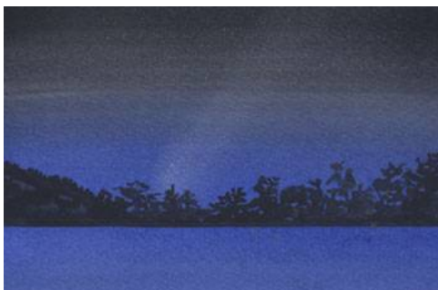
3、湖の対岸の森影を描きます ランプブラックという色を使っています