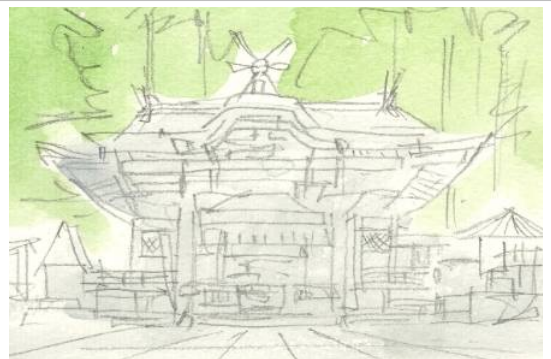
3、背後の森もとりあえず 一様に緑で塗っておきましょう