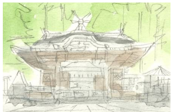
4、目を細めて見て 茶色の場所は茶色に 赤い場所には赤を置いてみます 少しずつ色を重ねていって完成です。