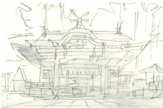
2、建物はとりあえず灰色に塗っておきます 立体感など気にせず 面的に一樣に