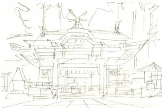
1、下絵の線は最小限にしたほうが良いのですが こういう建物の場合 どうしても描き過ぎてしまいます