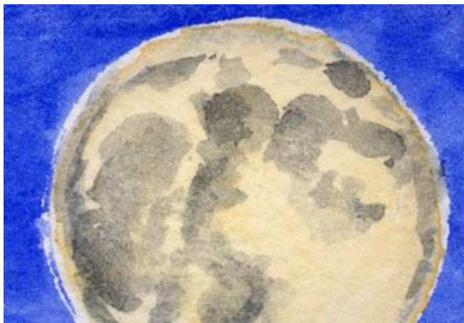
2、満月は色が難しい ジョンプリアン(肌色)が基本です