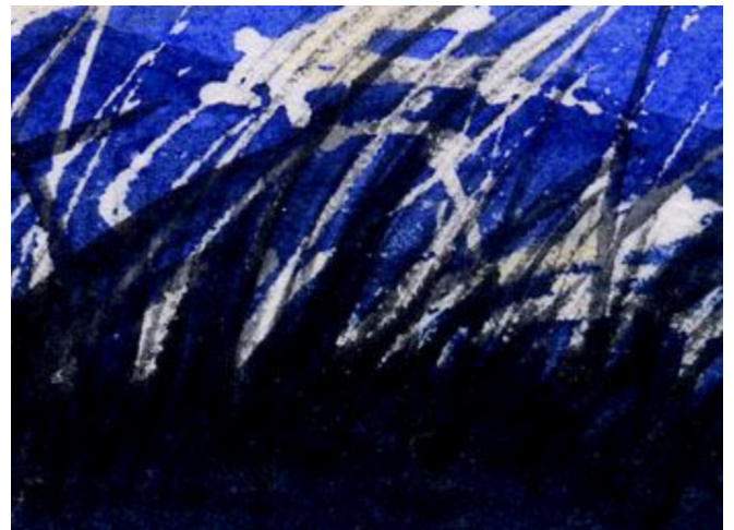
4、ススキの下部は真っ黒に塗って 影としました