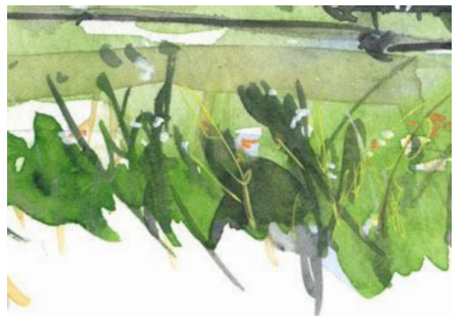
6、草原は前景に乏しいので 草をやや濃く描いておきます