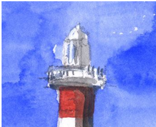
2、主題の灯台だけを あまり細かく描かないように