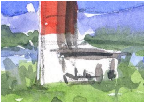
3、灯台の左から光が当たっていると意識して描きます