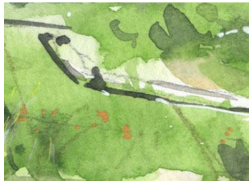
5、草原の木道 これも描き過ぎないように