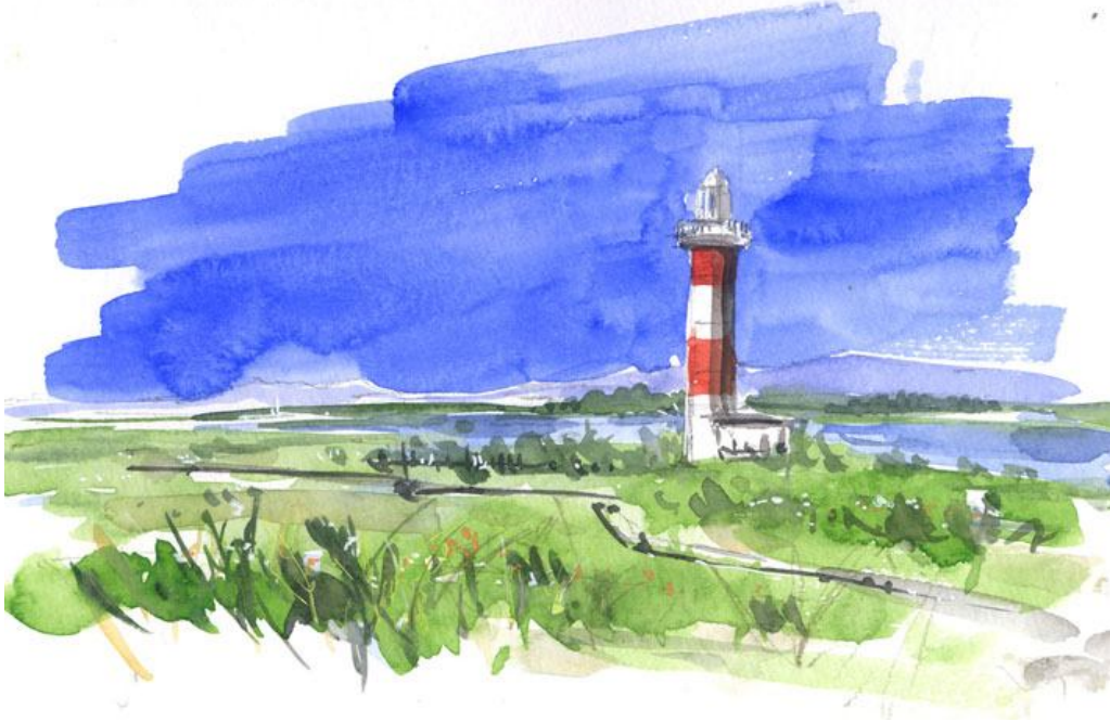
これが完成した絵です

石狩灯台は 石狩川の河口にあります 灯台というと 断崖絶壁の上に建っているものを想像しますが 石狩灯台は草原の中の灯台です 札幌から遠いですが 私は毎回ここを訪れています 灯台と川と草と花・・・それ以外は何もありません その何もないのがいいのです