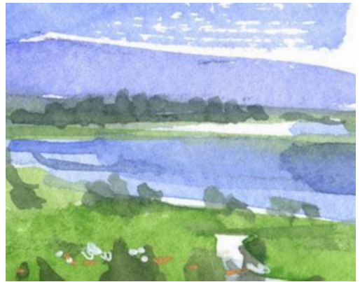
4、遠くの山と石狩川 彩度を抑えて ひと筆で描く