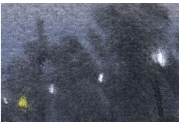
3、街灯の列で 遠近感と「夜らしさ」を表現します