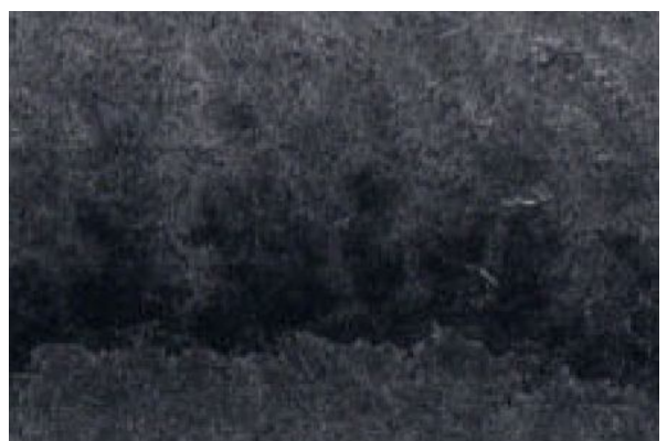
6、画面に偶然に現れる このような模様もそのまま生かしてみました