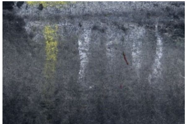
5、さまざまな灯火の 路面への反映もパステルで表現しました