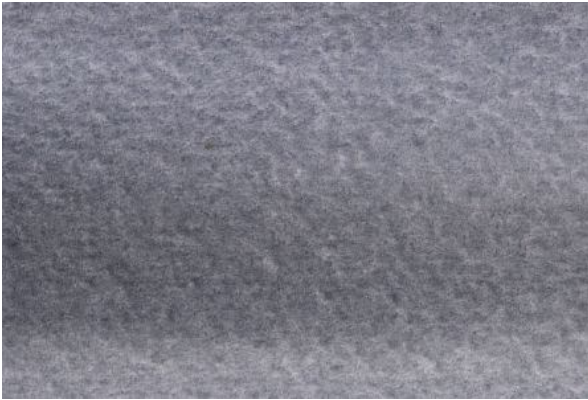
1、「夜霧」そのものは描きようがないので 画全体を暗いグレーで滲ませる感じです