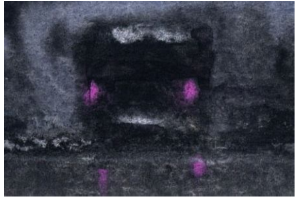
4、遠ざかるバス 室内灯も描けばよかったと あとから思いました