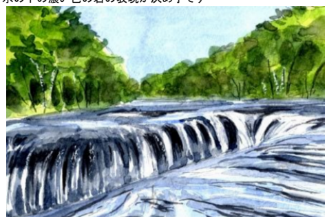
6、岩と水の流れのコントラストが重要です。大胆かつ慎重に！