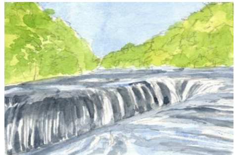
5、滝の立体感は、水の下濃い色の岩の表現が決め手です