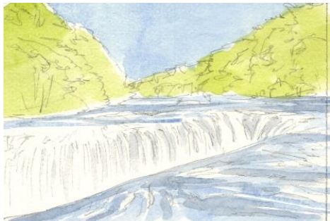
2、背後の森は「リーフ・グリーン」で薄く塗っておきましょう