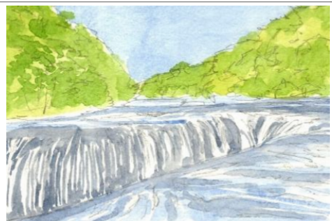
4、背後の森も少しずつ濃くしていきます