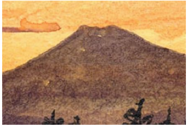
4、空の次に山を描きます 山はやや濃い紫で 空が乾いてから 一気に描きます