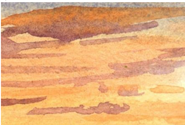
3、雲は 薄い紫色で表現します 紫にもやや濃淡をつけると良いでしょう