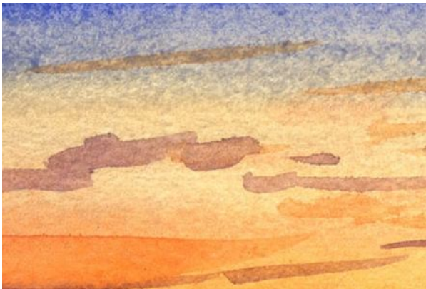
2、空のグラデーションは ごく短時間で仕上げます偶然現れる「滲み」も そのまま生かします