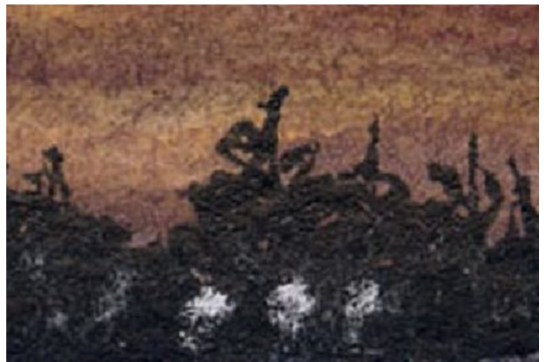
5、最後に森影を描きます 濃いブラックか 墨を使います 湖畔の灯火は 白のパステルを使いました