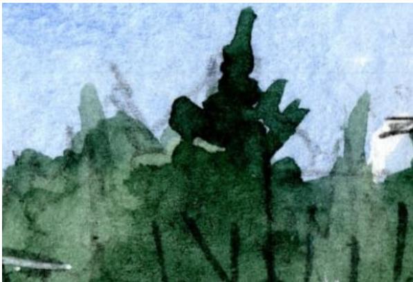
1、東北地方にも走っていたので 背景は針葉樹 季節は早春にしました