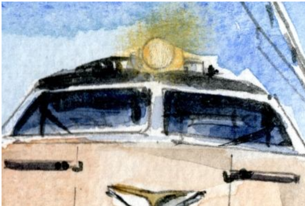
2、高運転台は意外と暗くします ワイパーやヘッドランプも細かく描きましょう