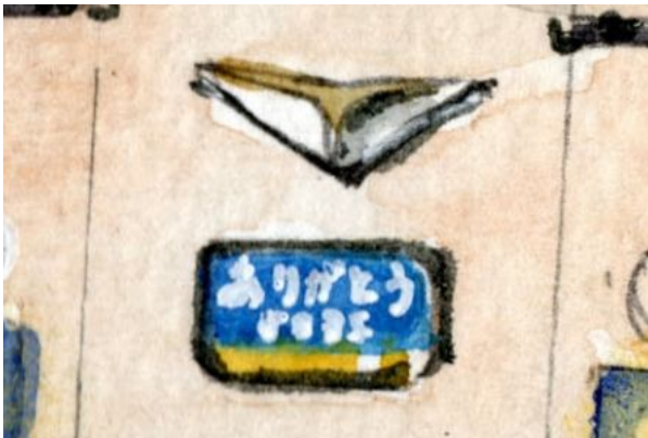
3、国鉄のエンブレムとヘッドマーク これも出来る限り細かく描きます