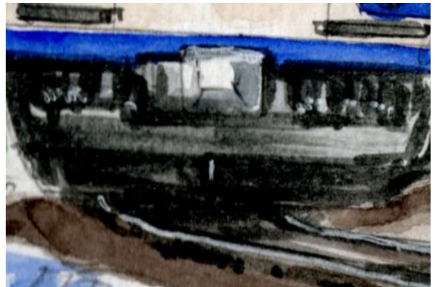
5、鉄道車両は 床下と線路が一番難しいです 何度も描くと慣れてきます