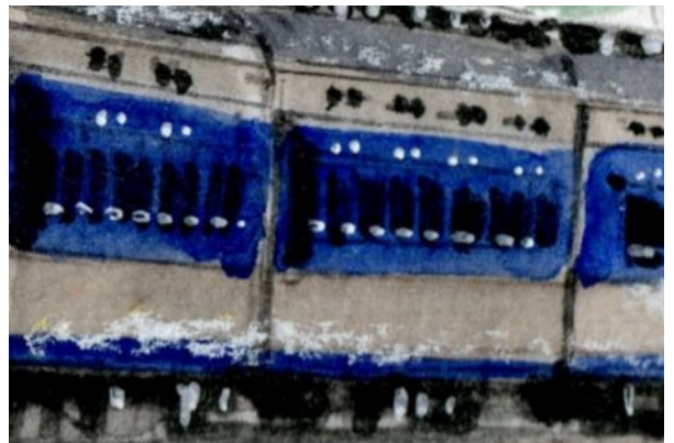
6、窓の上の白と黒の「点々」は 寝台中段・上段の小窓です