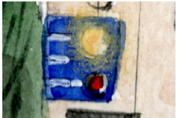
4、前照灯は黄色と白のパステルでぼかすようにして表現しました