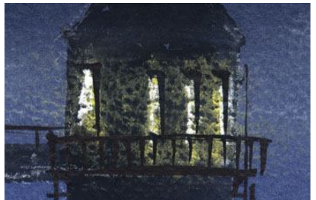
3、建物(取水塔)を明るく描くことで 周囲の暗さを表現します