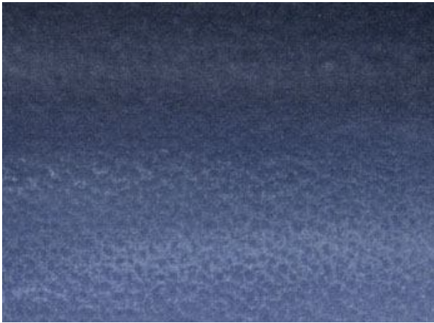
1、暗い背景に 何となく霧がただよっている風に描きます