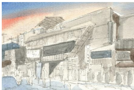
3、更に色の濃い部分(たとえば大きな看板)をもっと暗い色で塗り重ねます