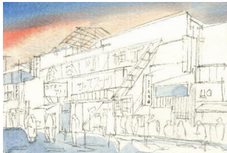
1、夕暮れの空と路面から描きます。何色だろう？とあまり考えずにサラッと塗ってしまいましょう！