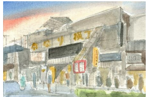
4、人物の服装、看板、掲示板の枠等だんだんと細部の色を重ねていきます