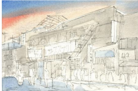
2、建物の「灰色に見えるところ」を全部灰色に塗ってしまいましょう。この自転では立体感とは考えなくて良いです。