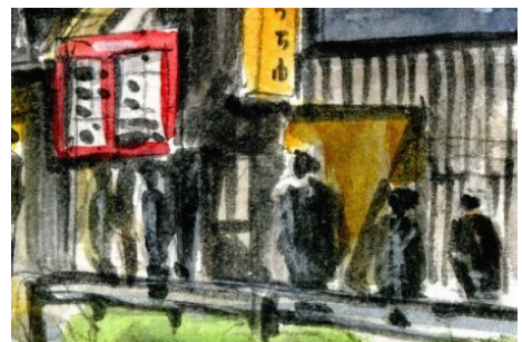
6、夕暮れ時っぽく、看板や建物の中からの灯りを表現してみましょう