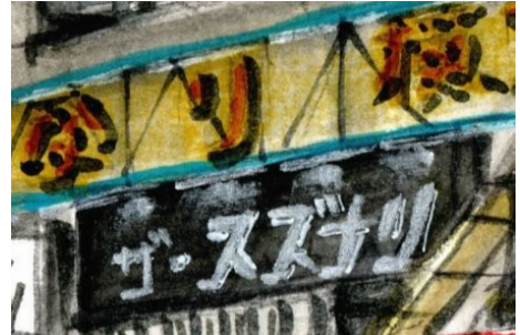
5、「ザ・スズナリ」の看板の「白文字」は、白の「パステル鉛筆」で描きます