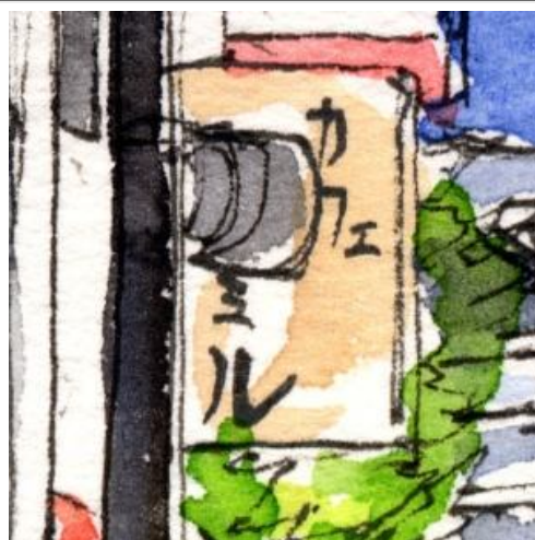
2、看板や街灯は できるだけ忠実に描いてみましょう