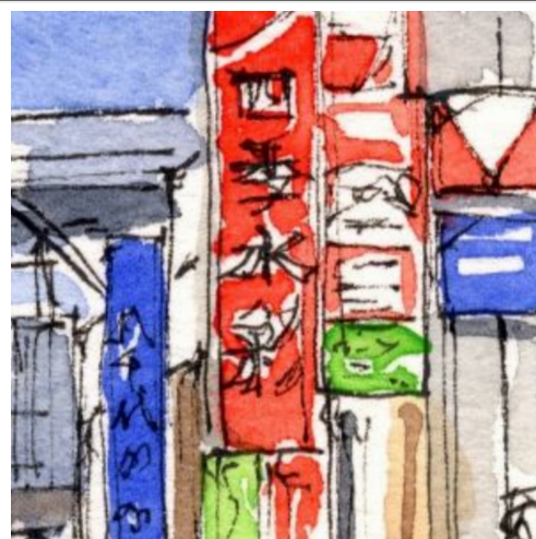
3、看板の重なりは難しいです 文字は適度に省略して描きましょう