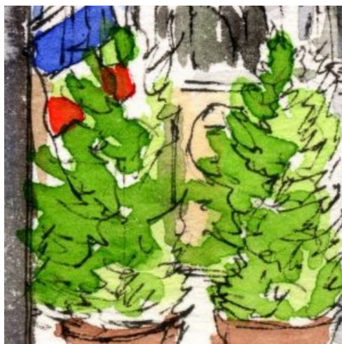
4、店頭の鉢植えも構図の上では大切な存在です