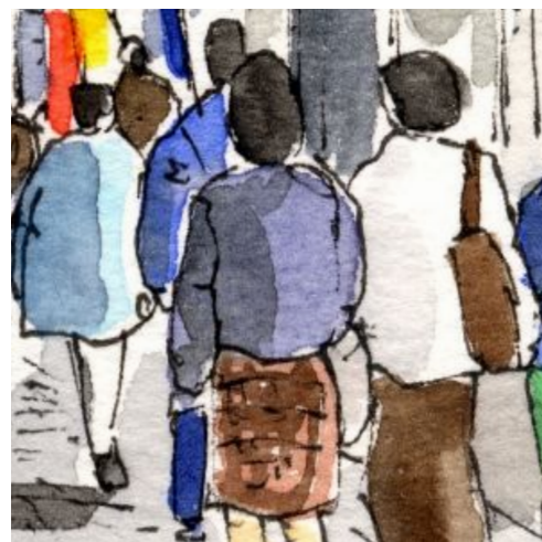
6、いろいろな服装 年齢の人物を混ぜて描きます