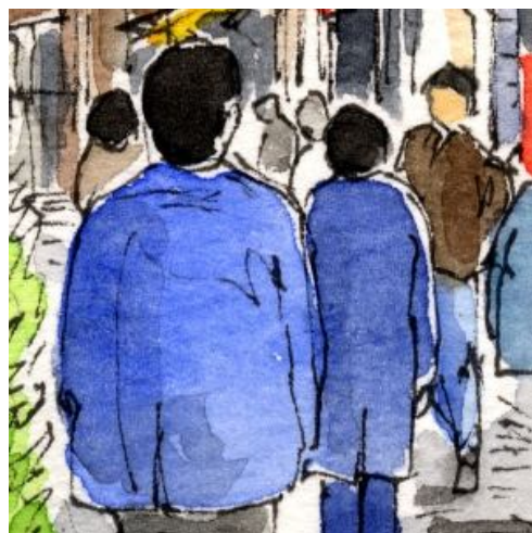
5、人物は基本的に「後ろ姿」で描きました