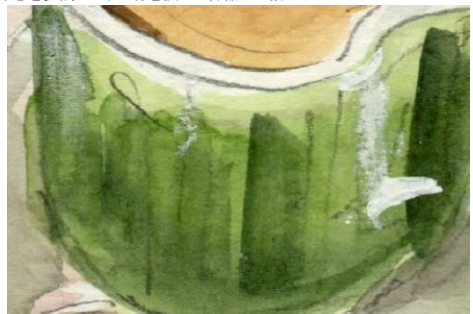
6、最後にパステルでハイライト(光って見えるところ)を描いて 完成!