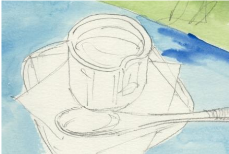
1、背景は塗らなくても良いですが 一応プリンの反対の色で青 テーブルクロスも青にしておきましょう