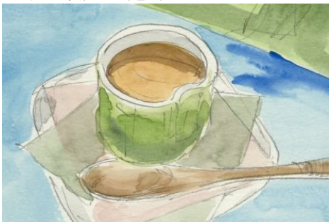
3、これもちょっとずつ濃く このあたりで完成でも良いです