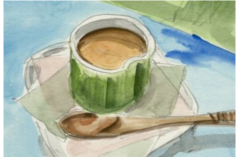
4、少し立体感出しましょう