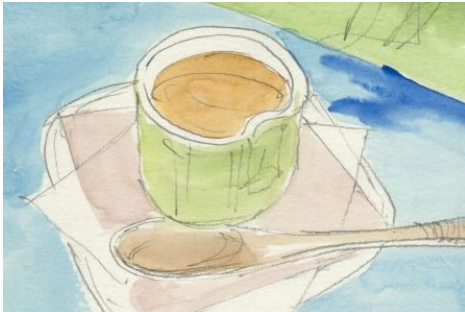
2、カラメルがかかっているので 紅茶みたいな色です