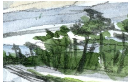
5、主題の松林は サップ・グリーンにシャドウ・グリーンを重ねて描きます