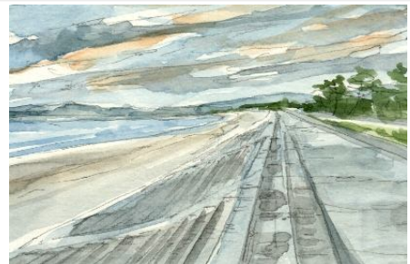
4、このあたりは松並木っぽんですが 並木にしなくてもいいです 松があるなってぐらいが良いです