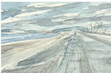
3、目を細めて濃いところを濃くしていくのが良いです