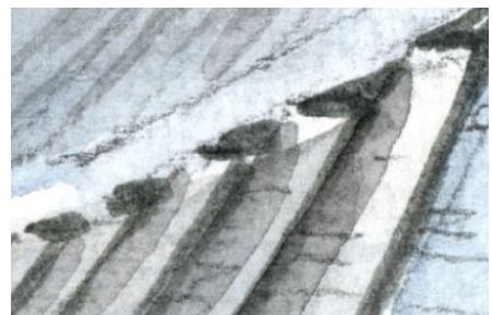
6、階段の角ツコに影をつけて 砂浜に点々をつけて 完成です