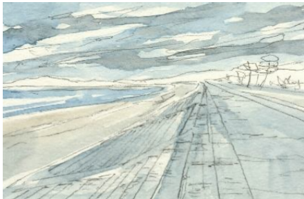
2、海も同じ色で良いです 砂浜は少し肌色を混ぜたグレー コンクリの築堤も似たような色で塗ってしましましょう