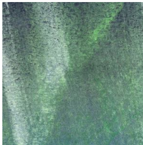
2、パステルでオーロラのアウトラインを描いたあと 指先で上に伸ばします