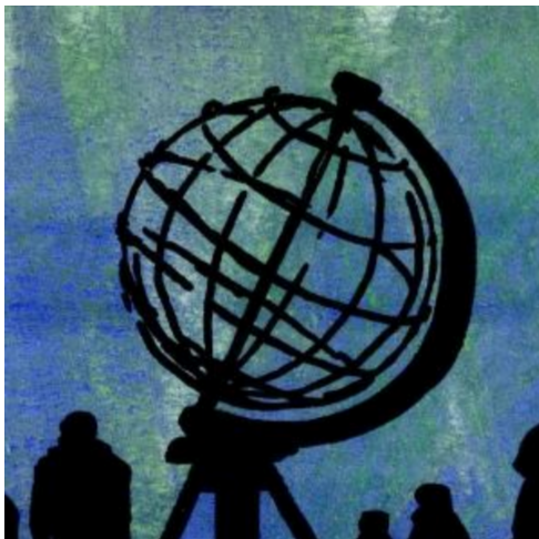
4、地上物はすべてシルエットで描きます この岬のモニュメントの形が 一番難しいです