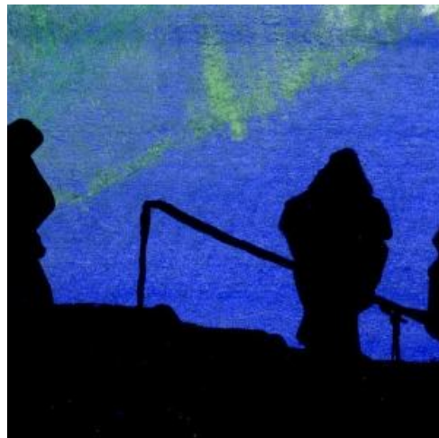
5、台座への手すりのシルエットは 意外と効果的です