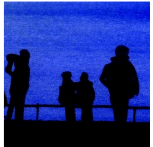
6、オーロラを観望する人々も いろいろなポーズのシルエットにします