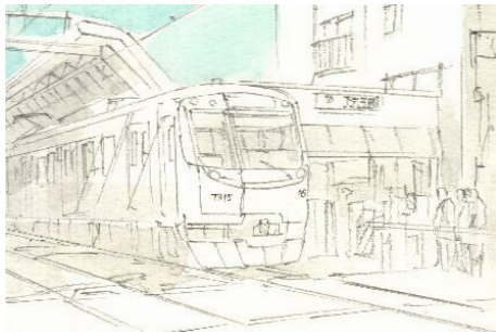
2、空と影の部分から とりあえず色を置いてみます