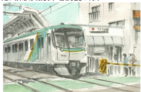
6、電車の床下も暗くします。実は難しいのは線路です。最後に行先表示などの細部を描いて完成とします