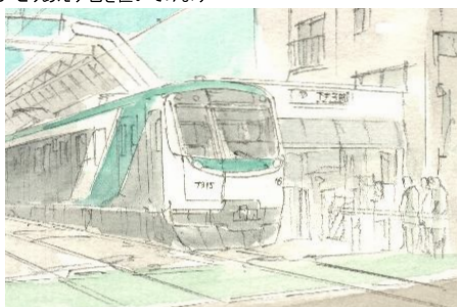
3、最初から濃い色にしよとせず 少しずつ濃くしていきます