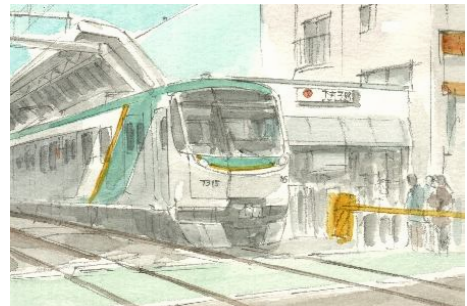
5、電車の窓はかなり思い切り暗くしておきます。踏切も色をつけます