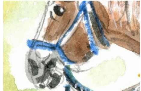
4、お馬さんの顔はかわいらしく 特に目は気持ちをこめて描きましょう