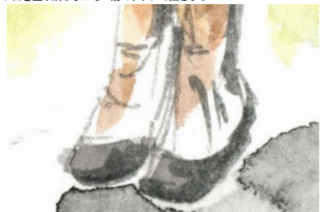
6、脚はあまり塗り過ぎないように 少しずっしりした感じに描きます