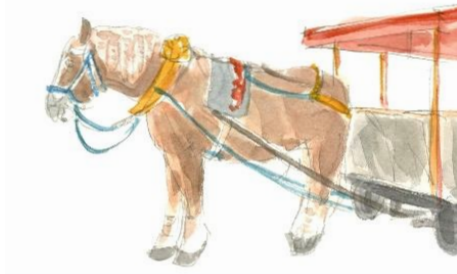
3、塗り残していた馬具にも色をつけます 後ろの牽き客車はあっさり塗りましょう