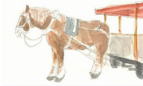
2、一部分を丁寧に塗るのではなく 全体を見ながら「平等に」色を濃くしていきます