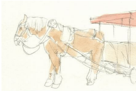
1、まずは全体をごく薄く塗っておきます