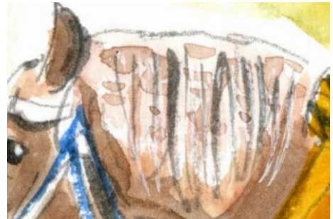
5、「たてがみ」はやや白を塗り残しながら 縦のタッチで描きます