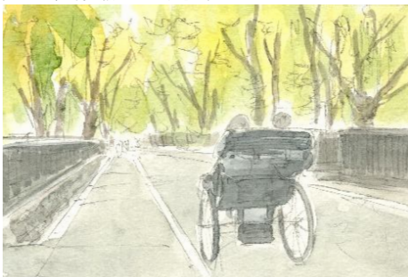
3、ここで樹木の幹に色をつけておきます 人力車や板壁を少しずつ濃くしていきます