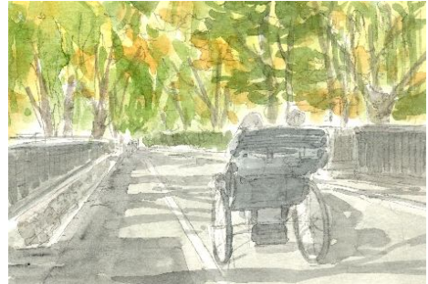
5、背景の樹木に濃い緑 濃い黄色などを加え 深まり行く秋を表現します