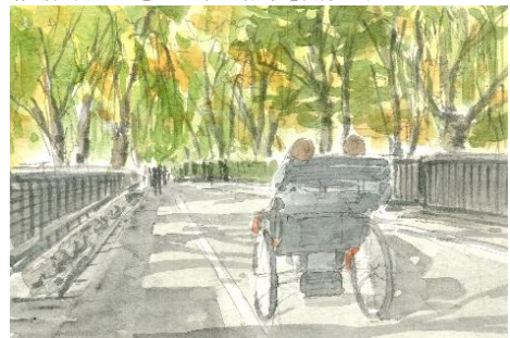
6、板壁の模様 側溝の石組の立体感 人力車の乗客の髪など 細部に色を加えます 最後に紅葉を濃くして完成です