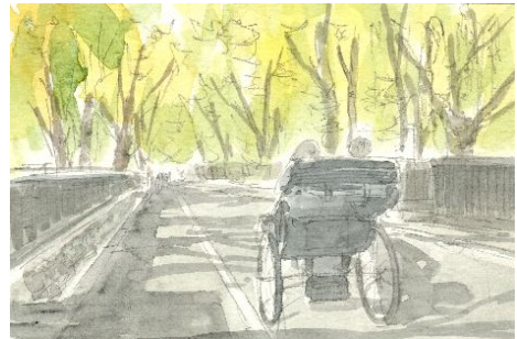
4、このあたりで 路面の影を描いておくと良いでしょう 太陽光は 画面左側から当たっています