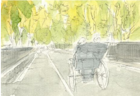
2、樹木に緑を足します 人力車も薄い黒で塗っておきます