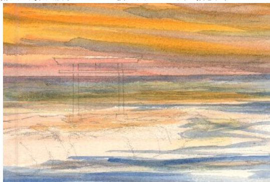
2、水平線より下の海面も 横のタッチで濃くしていきます