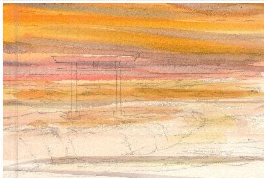
1、背景の朝焼け 海面 波などは ほぼ横のタッチで一氣に描きます