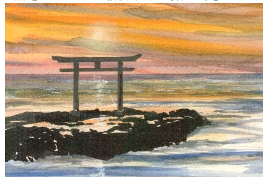
4、鳥居と岩礁を すべてシルエットで描きます 最後に岩礁から流れ出る 海水のすじを描いて完成です