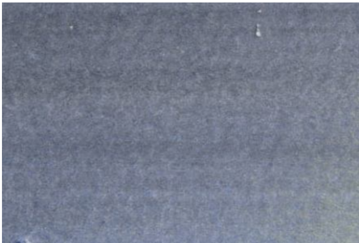
1、夜空は徹底して「横のタッチ」で 短時間で描き切ります 空の上のほうをやや暗めにします