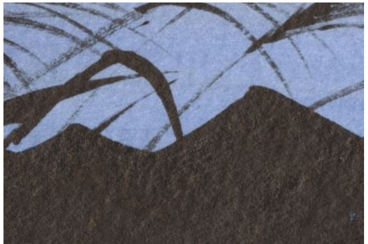
4、遠くの山もシルエットにします 前景・中景を暗くすることで 満月の明るさが引き立ちます