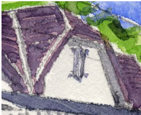
2、ホーム側屋根の立体感 難しい形ですが がんばって