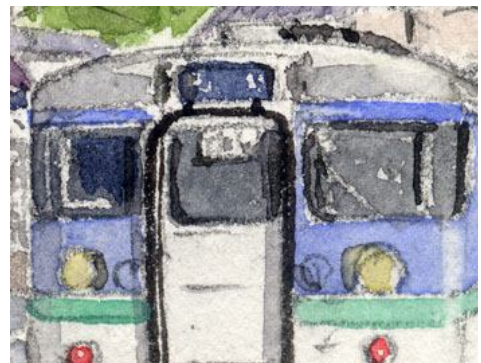
5、電車の前面 電車はデッサン狂いが命取りなので 縦横比を正確に