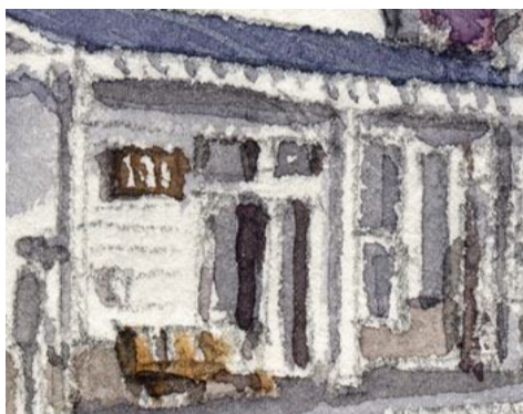
3、駅舎の軒下 駅名板やベンチもできるだけ描写