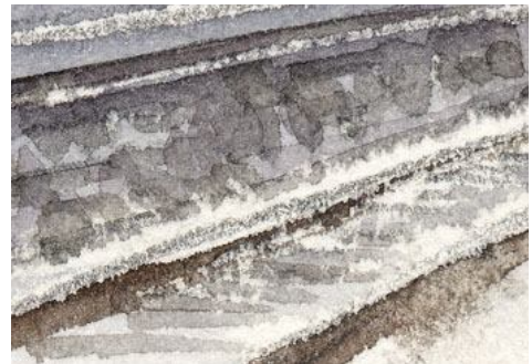
4、ホームの石垣と線路 線路も立体感を出すよう努力