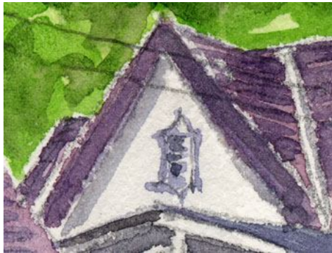
1、三角屋根の立体感 天窓の飾り枠も正確に