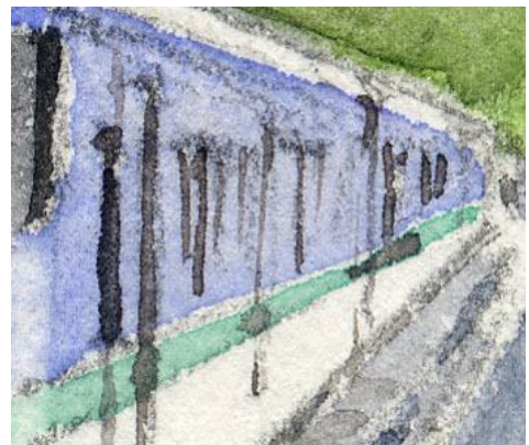
6、電車の側面 窓やドアは縦線1本で表現できます