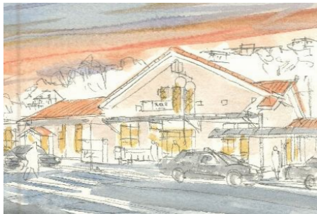
3、赤い屋根が重要です 駅前のタクシーも 薄く塗っておきます