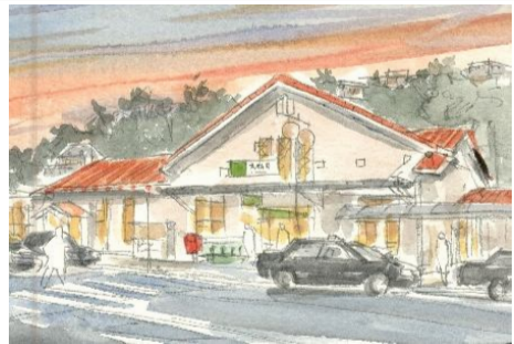
4、背後の樹木は シャドウ・グリーン(深緑)を薄く塗っていきましょう