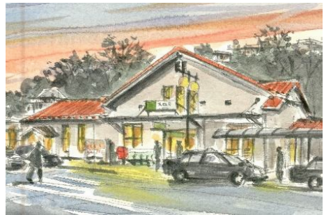
6、駅舎内の灯火が 路面に反映する様子は 黄色のパステル(またはチョーク)を指先で伸ばして表現します