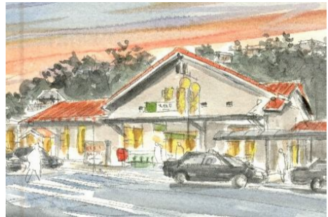
5、全体のバランスを見ながら 少しずつ細部を仕上げていきます