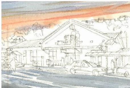
1、空から塗ります 夕焼け色が乾かないうちに 上空の青も重ねて 適度に滲ませます