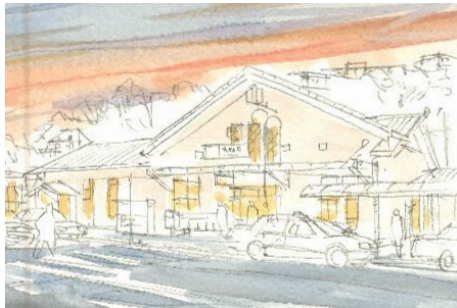
2、駅舎の壁面には「ジョン・ブリアン(肌色)」を 薄く塗っておきます 駅舎内の灯火も塗っておきます