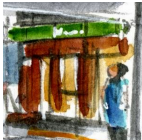
6、構内のコンビニ お客さんが出入りする様子を描けばよかったです