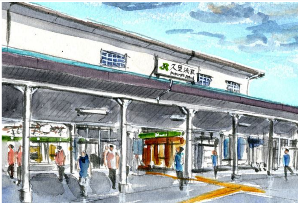
これが完成した絵です

横須賀線の終着駅は「横須賀駅」のような気がしますが 実は2つ先の「久里浜駅」です 横浜に行くのにも都内に行くのにも 京浜急行の ほうが安くて早いで 近くにある「京急久里浜駅」のほうがずっと賑わっています しかし私は歴史ある横須賀線の終着駅である 元祖 「久里浜駅」の雰囲気が好きです