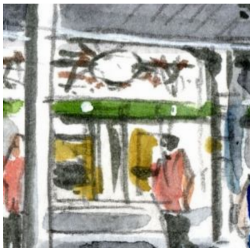
4、このあたりが「切符売り場」なのですが なかなか表現が難しいです