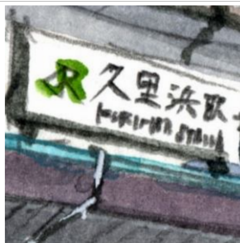
3、駅名板は大切な「部品」ですが ここだけ丁寧にし過ぎないことが大切です