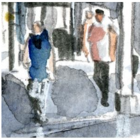
5、人物をできるだけたくさん描いて 「駅の活気」を表現しようと思いました