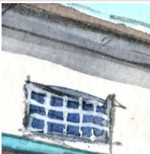
2、屋根の「ひさし」と 格子模様の天窗 駅の「顔」は できるだけ正確に表現します