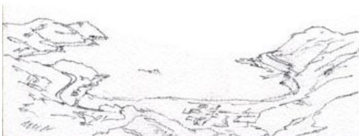
1、手前の入り江と集落から描きます。細かく気が済むまで描いてOKです。