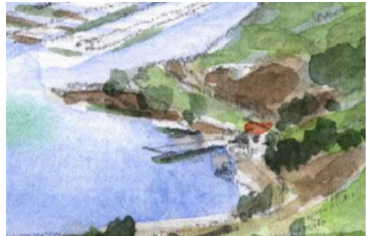
6、防波堤や棧橋を描いておくと、集落らしくなります。