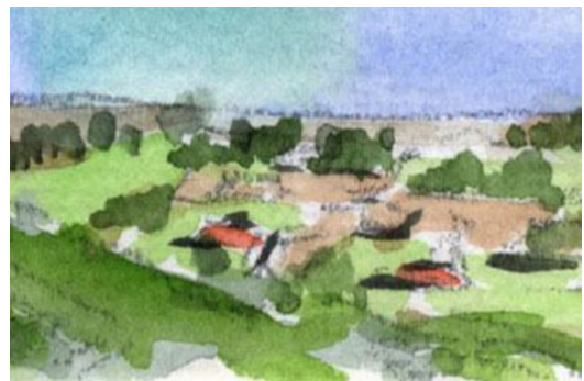
5、集落には、畑・家の屋根・樹木を配置します。