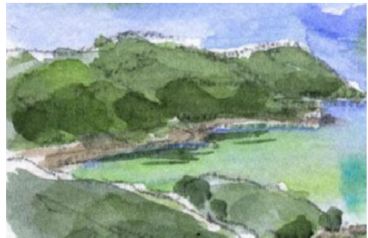
4、湾奥の水面はエメラルド色。海岸線の影は深緑で。