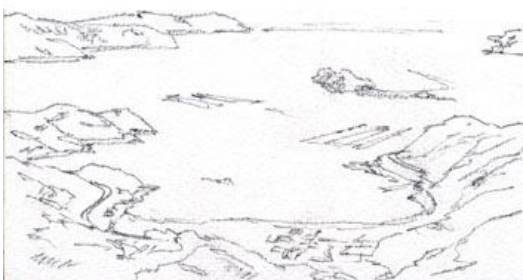
2、海峡の半島や小島を描きます。小さな岩は省略。