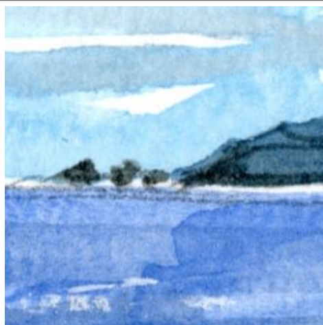
2、遠くの「真鶴岬」と「三ツ岩」 こういう風景は 車窓に一瞬しか見えないので 一瞬で記憶する訓練が必要です