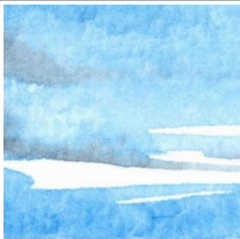
1、空は海よりも少し薄くします 雲は塗り残して表現しましょう