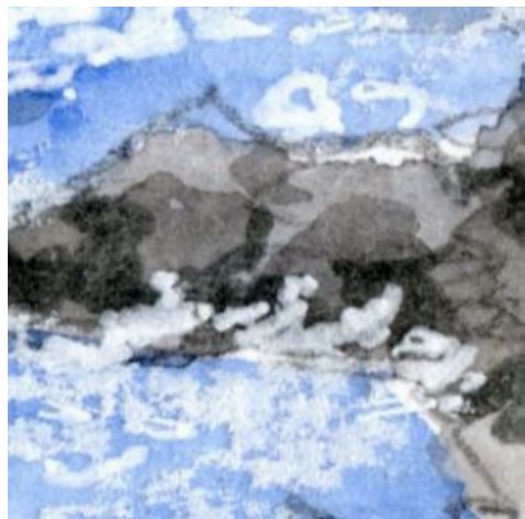
4、海岸の岩と そこに跳ね返る白波 やや海が荒れている雰囲気表現します