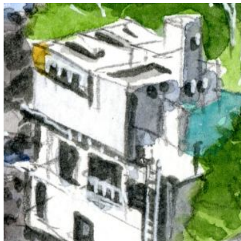
5、海辺の建物 たぶんドライブインか小さなホテルでしょう この建物は構図上 重要です