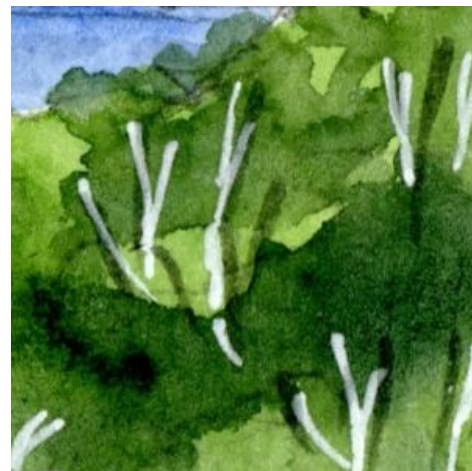
6、右手を埋め尽くす 照葉樹林 影になっている部分は「シャドウ・グリーン」で表現します