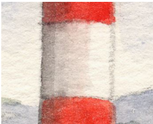
3、灯台の基部 まず赤のストライプを塗って その後左側に影をつけます