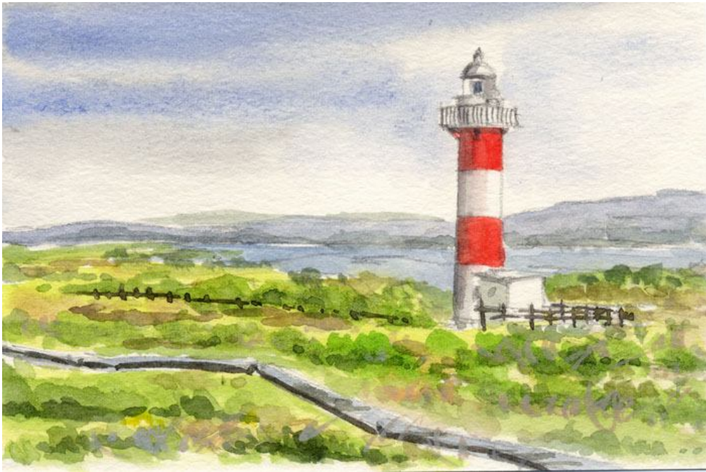
これが完成した絵です

灯台というと 断崖絶壁の上にある印象があります しかし中には全く平坦な土地に建つ灯台もあります「石狩灯台」もその一つです それもそのはず この灯台は石狩川の河口の平原に建っています 何も無い原野に忽然と建っている 寂しい灯台です 私は日中しか見たことがありませんが 夜はさぞ孤独な光を放っていることでしょう