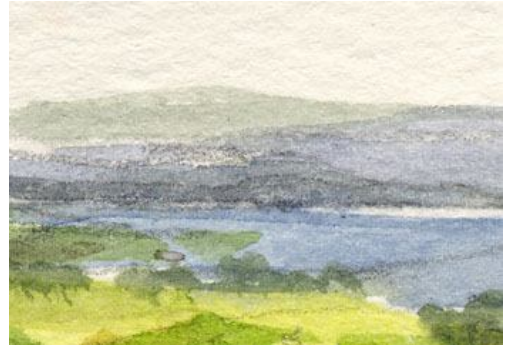
4、対岸の丘は やや彩度を落として 遠近感を出します