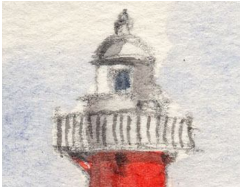
2、灯台頭部 左側を意識的に暗くします