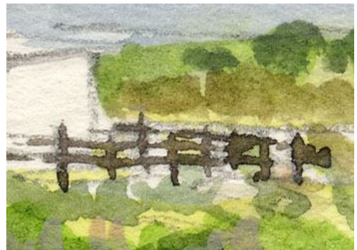
5、こういう何も無い風景の中に 柵は効果的です