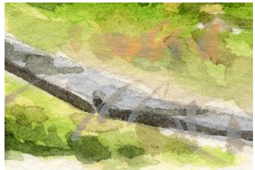
6、木道も描いておきます 影をつけて立体的に