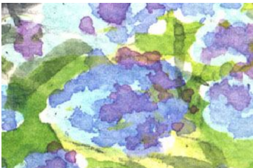
3、手前の紫陽花は やや立体感を意識して描きました