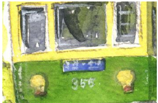
5、文字は白のパステル鉛筆で書きました