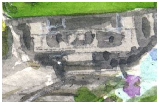
6、電車で一番難しいのは 実は床下です いかに省略するか