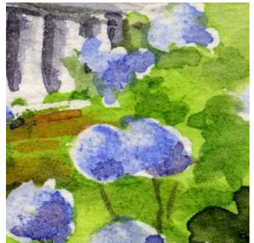
3、電車と重なる紫陽花は難しいです 紫陽花は基本的にマスキング液を使っています