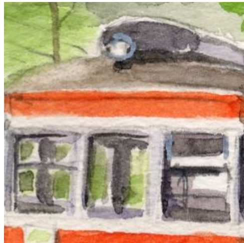
5、電車の顔は重要で 筆をゆっくり動かして 慎重に描きましょう