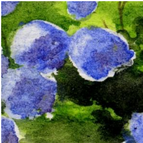
4、右側を暗くして 花房の立体感を表現します