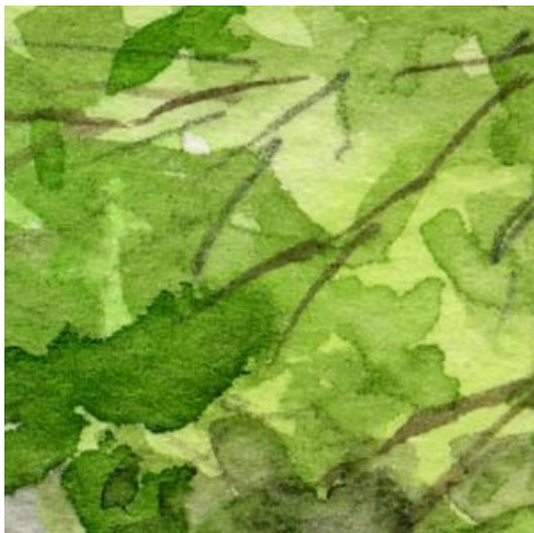
1、背景の木々は 何色かのグリーンを重ねて描きます