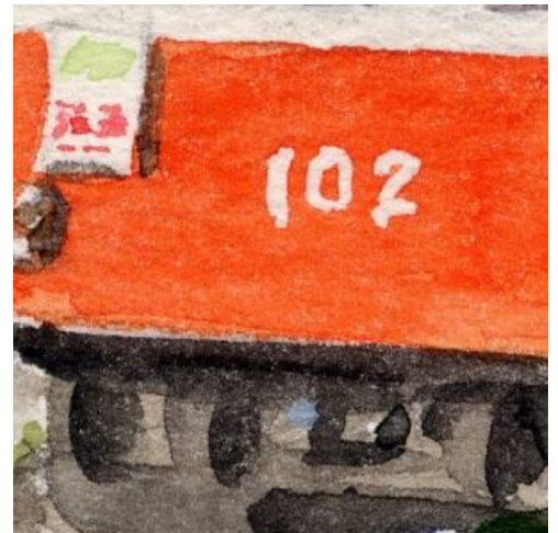
6、行先表示は「強羅」と書かれています 車体番号も結構効果的です