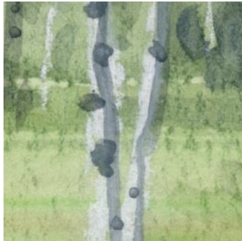
5、遠い白樺ほど 薄く描き 林全体の遠近感を表現します