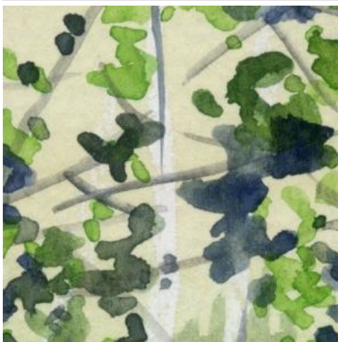
1、白樺の葉は 主として「リーフグリーン」「サブグリーン」を使います