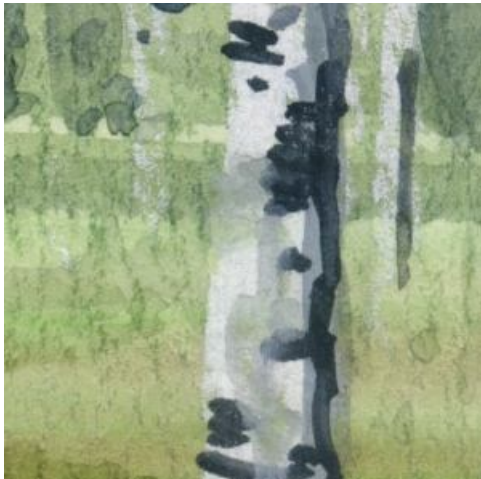
4、白樺の幹は 背景を描き終わったあと 白のパステルで描き そのあと樹皮の模様を描きます