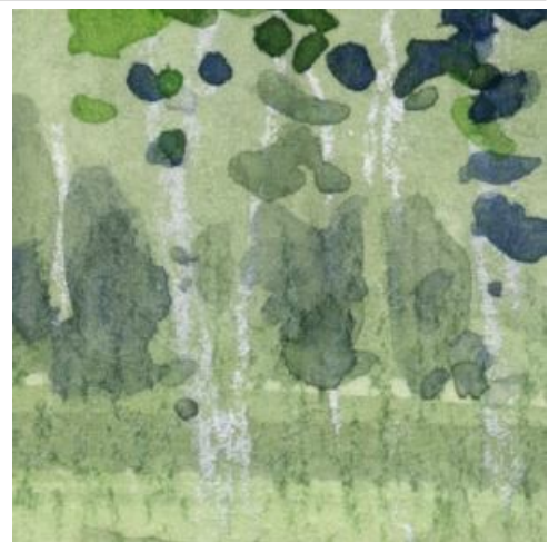
3、一番森の奥も「シャドウグリーン」を使って奥行きを表現します