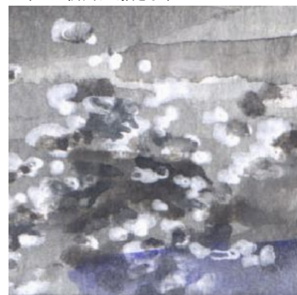
6、難しいのは 河原にある 水に少し浸かっている小石です ここは「修正液」を使っています