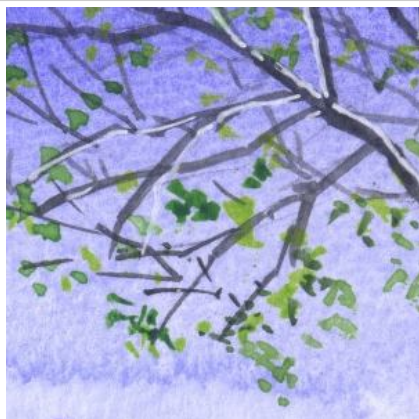
1、新緑の木々の梢は 背景の青空に重ねるように点描で描きます