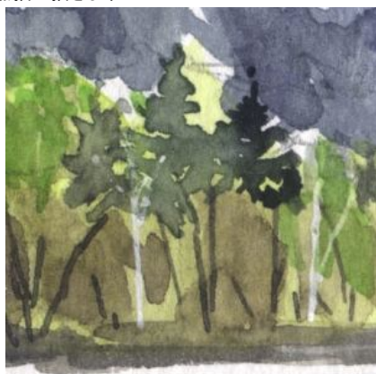
4、対岸の森は 何種類かの明度のちがうグリーンで描いています