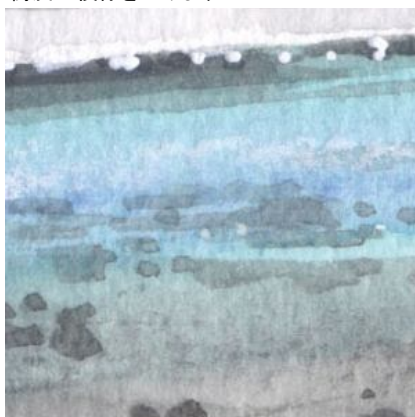
5、梓川は エメラルド・グリーン(黄緑+空色)で表現しました