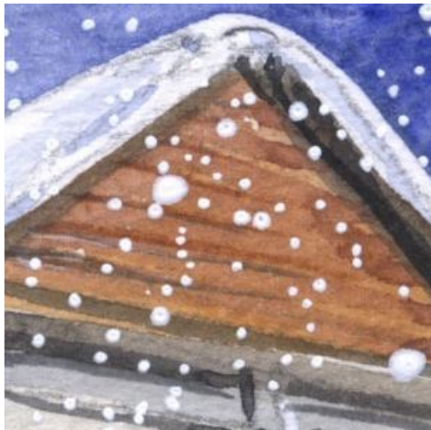
4、教会本屋の切妻は 横のタッチで木材の重なりを表現します