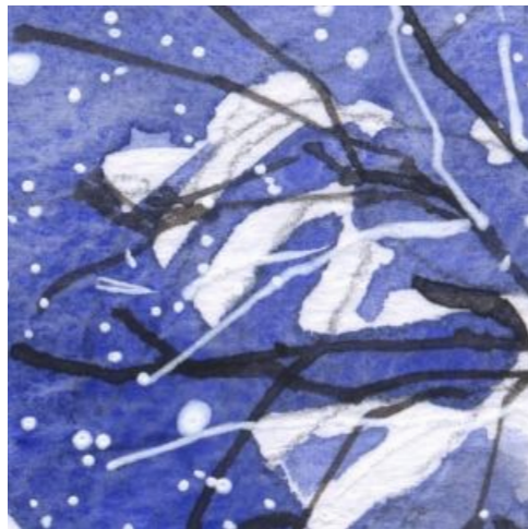
2、樹木の枝に積もった雪は 完全に「塗り残し」で表現します