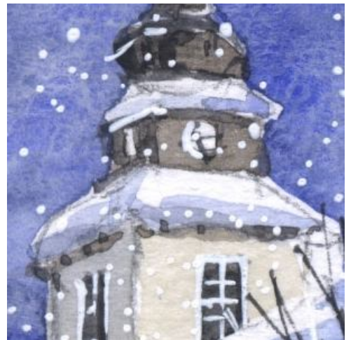
3、教会の塔は構図上重要です 立体感が難しいですが 面によって明るさをやや変えます