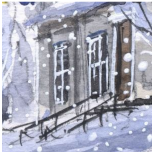
5、側面の入口と背の高い窓 ドアへ続く階段の手すりは 画面を引き締める役割をします