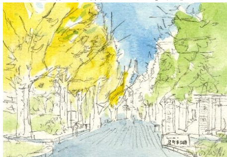
2、左側のイチョウ 右側の常緑樹を まずは薄く塗っておきます 最初から立体感や影をつけようとするほうが良いです