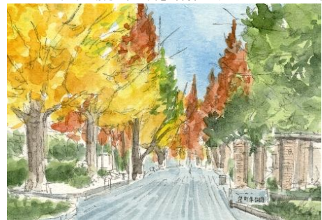
5、全体のバランスを見て 一部分だけ集中して塗らないようにしましょう