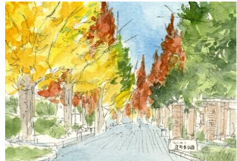
4、少しずつ濃く塗り重ねていきます 同じ濃さの絵の具を 何度も塗り重ねるのも 一つの方法です