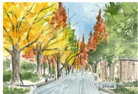
6、最後に枝に残った葉や 路面のイチョウの落ち葉を描いて完成になります