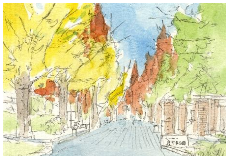
3、奥の茶色い樹木(メタセコイアの紅葉)も 最初は薄く面的に塗っておきます